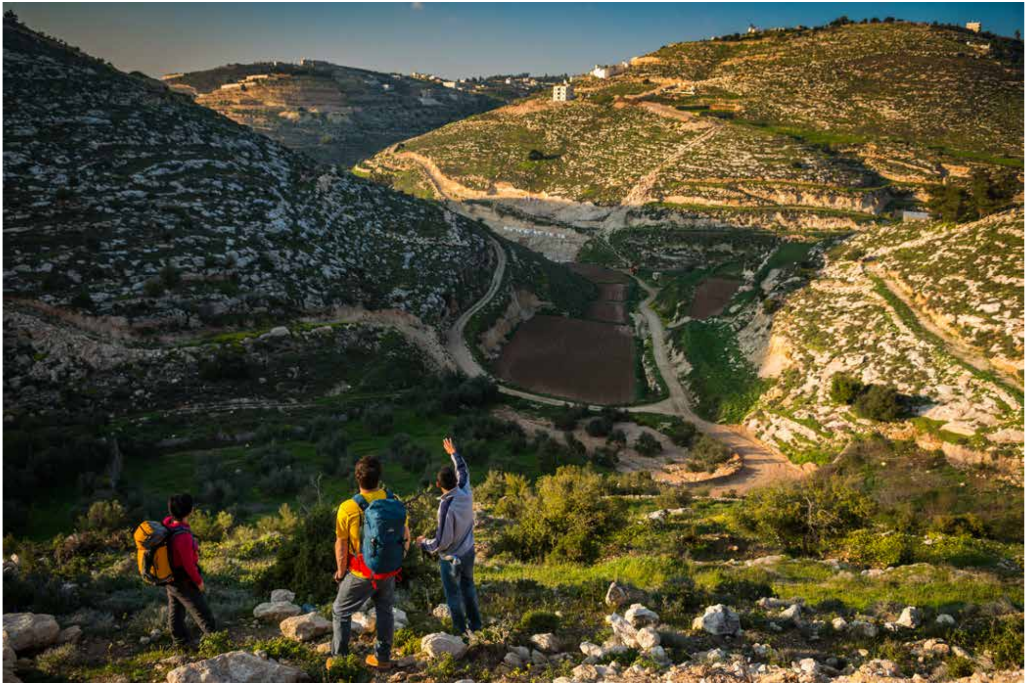
Legenda da foto. Nome do fotógrafo, ano

“No momento em que as minhas pernas começam a se mover, meus pensamentos começam a fluir.”