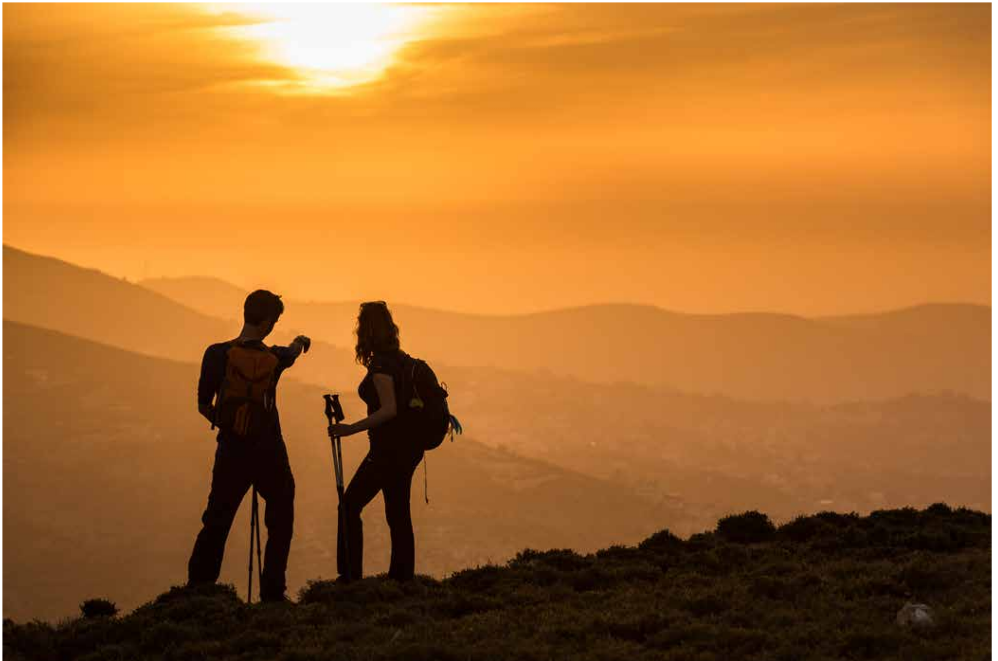
Legenda da foto. Nome do fotógrafo, ano