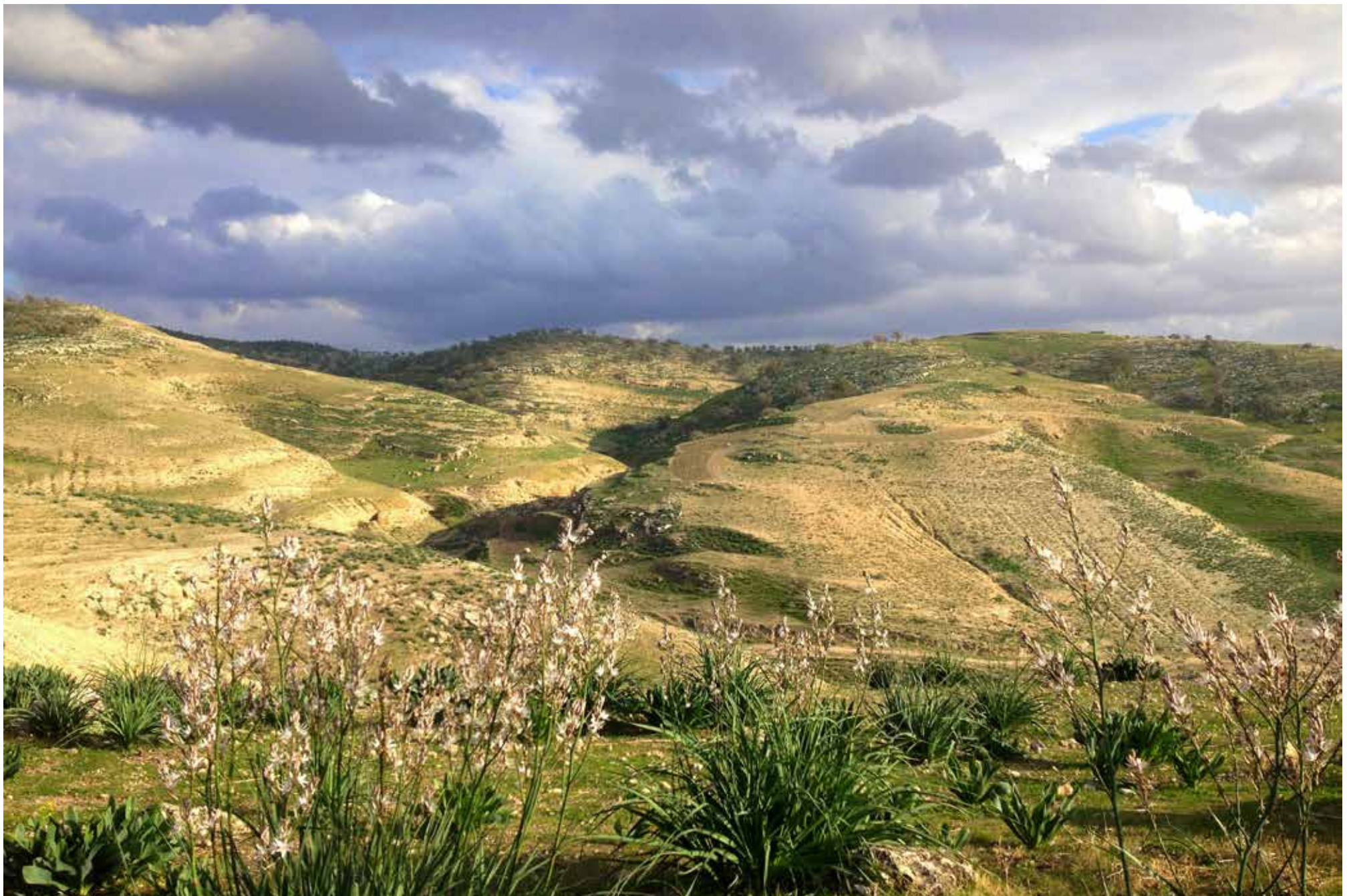
Legenda da foto. Nome do fotógrafo, ano

“Viajante não existe um caminho ... o caminho faz-se caminhando”