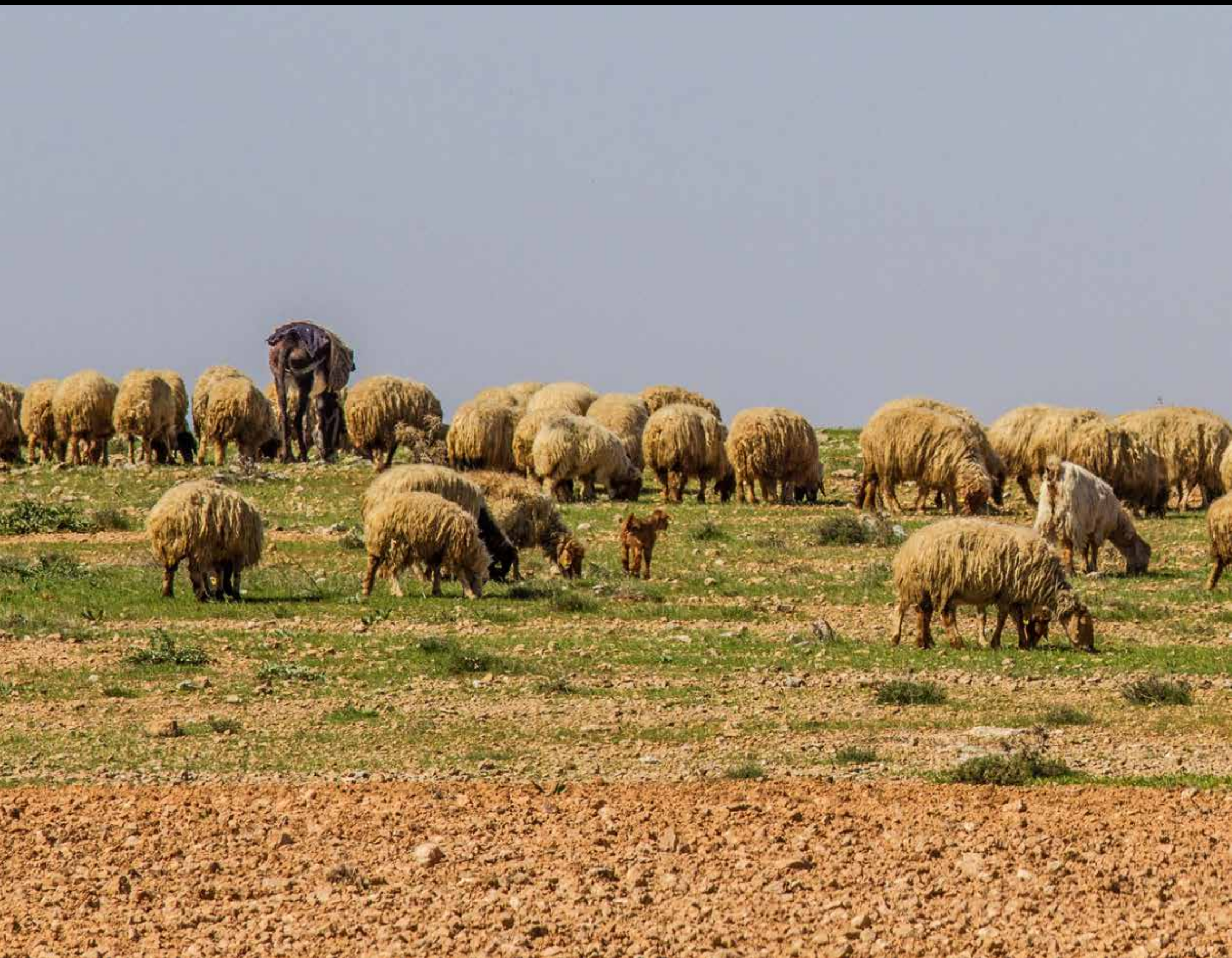
Legenda da foto. Nome do fotógrafo, ano