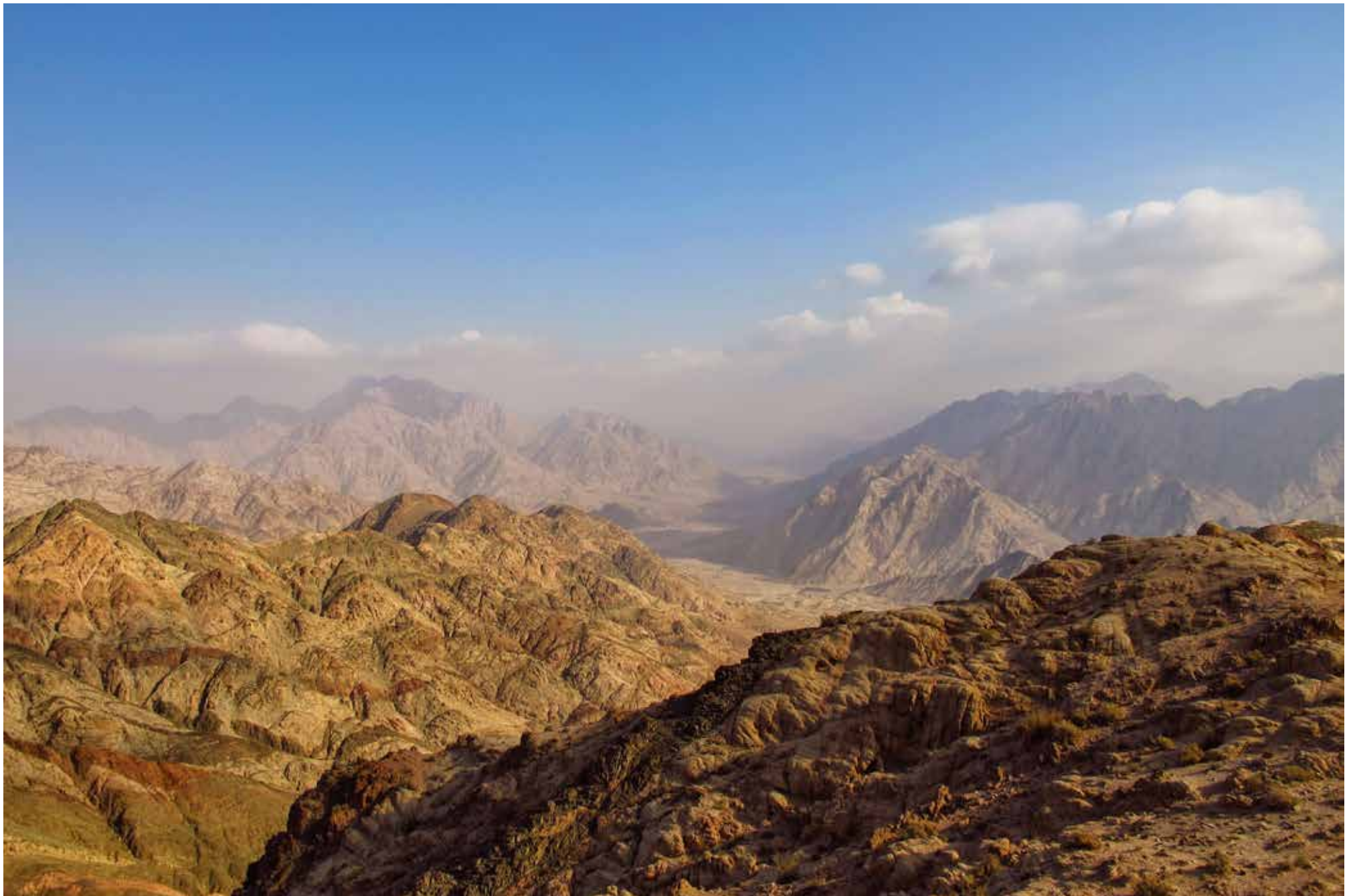
Legenda da foto. Nome do fotógrafo, ano