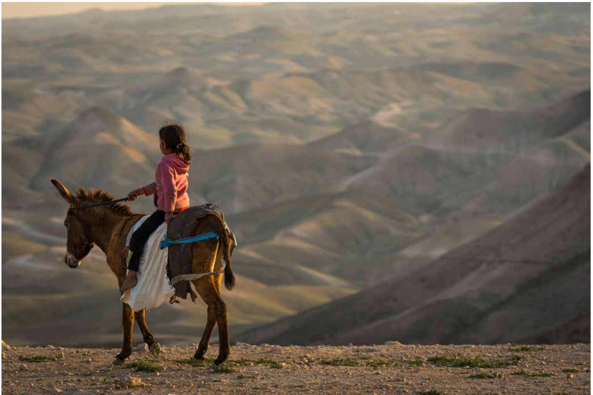
Legenda da foto. Nome do fotógrafo, ano