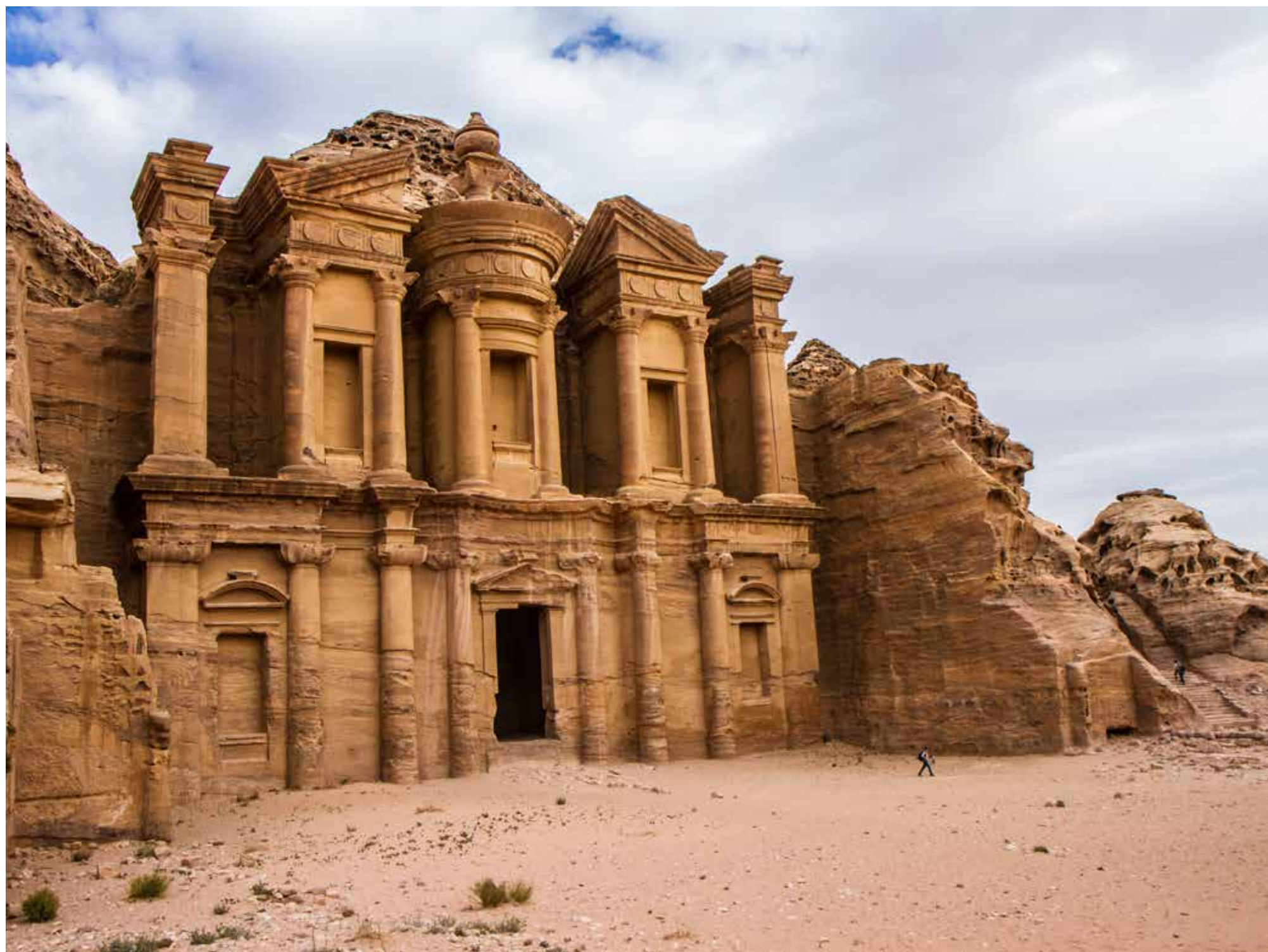
Legenda da foto. Nome do fotógrafo, ano