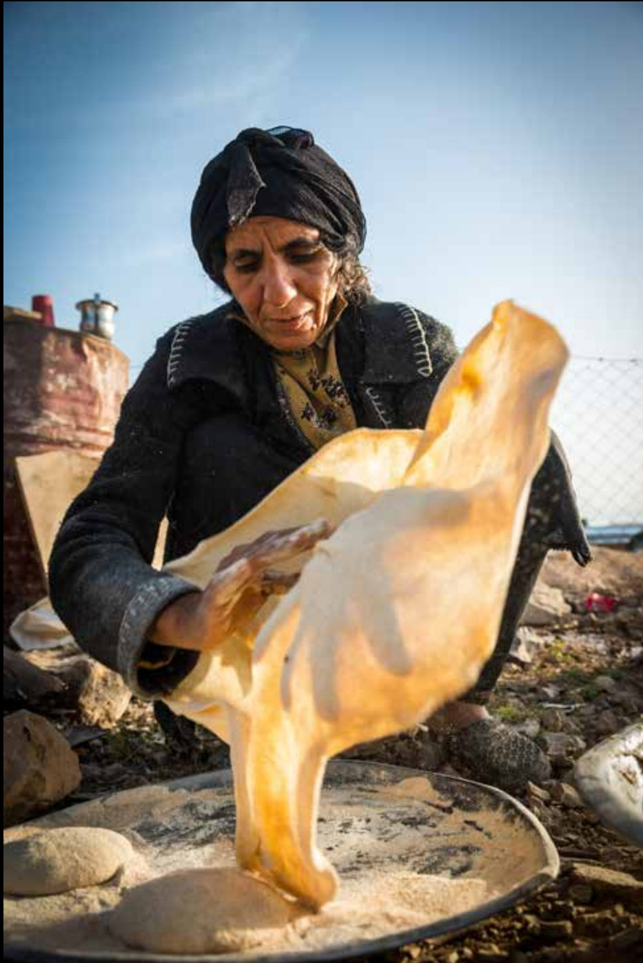
Legenda da foto. Nome do fotógrafo, ano