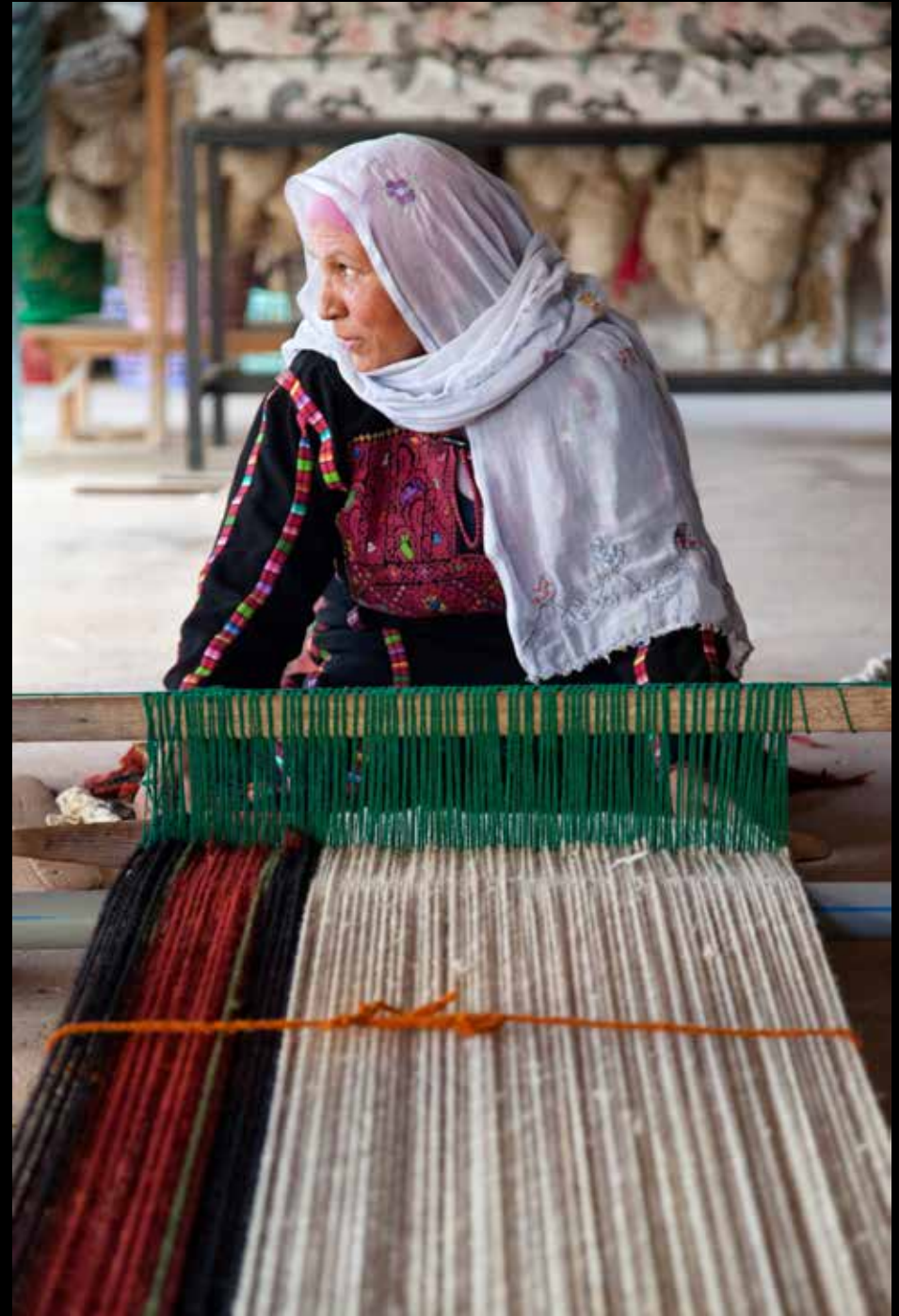
Legenda da foto. Nome do fotógrafo, ano