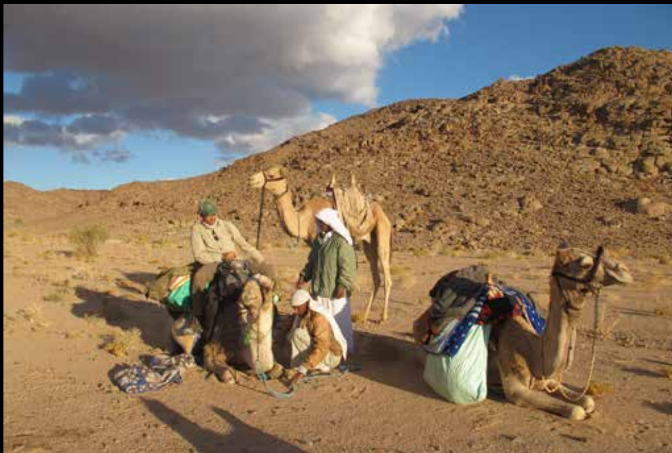
Legenda da foto. Nome do fotógrafo, ano

“Saia, encontre alguém novo. Aprenda uma nova língua, uma nova mitologia e religião. Se pessoas em número suficiente fizessem isso, nos veríamos o início do fim da demonização de outras pessoas ao redor do mundo.”