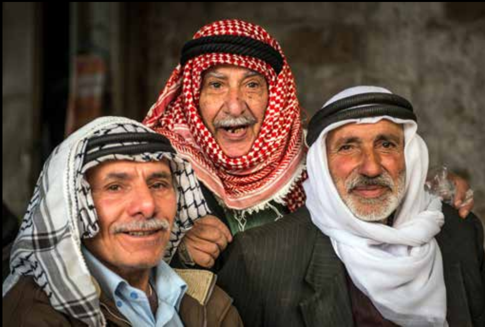
Legenda da foto. Nome do fotógrafo, ano