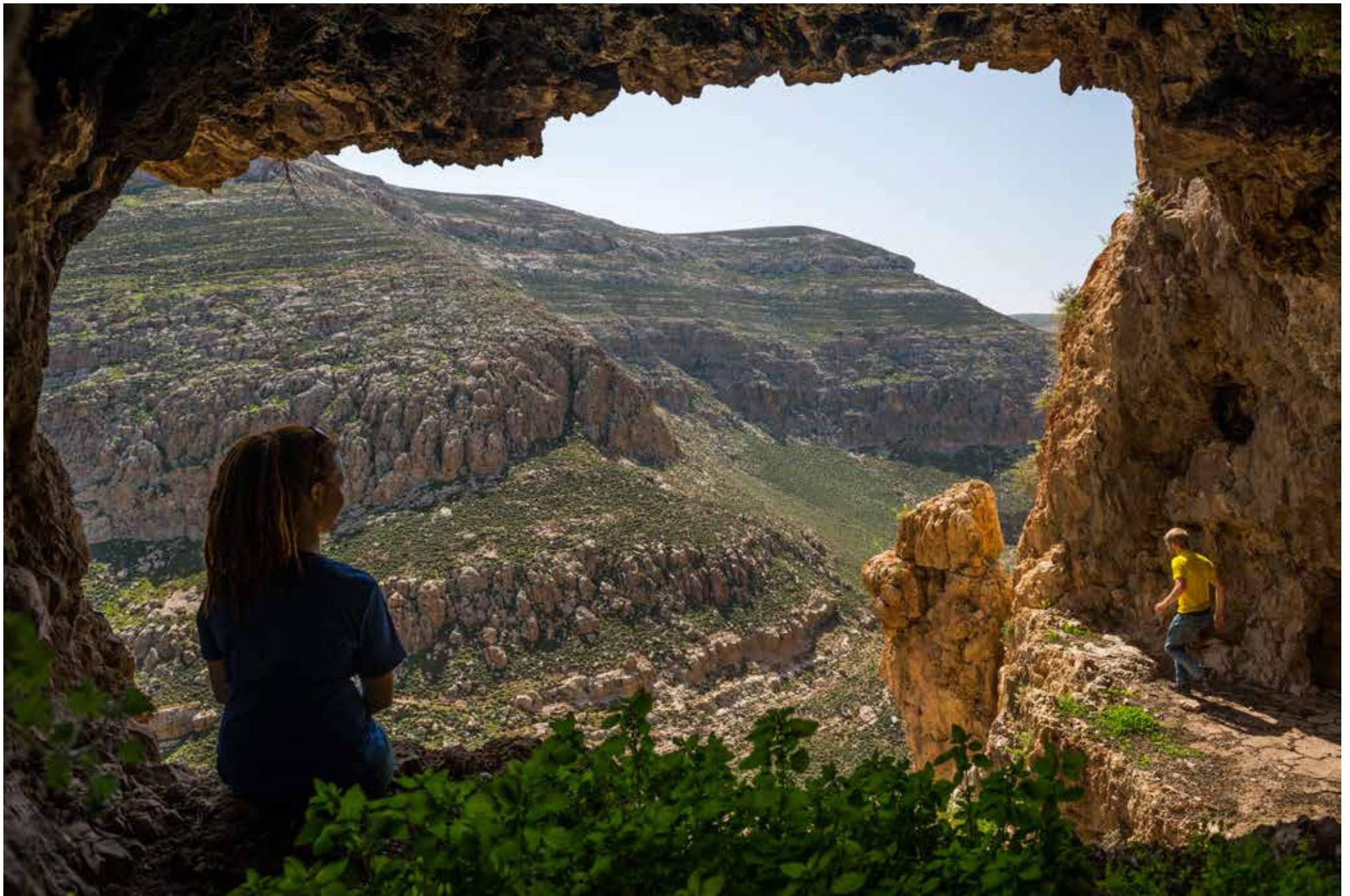
Legenda da foto. Nome do fotógrafo, ano