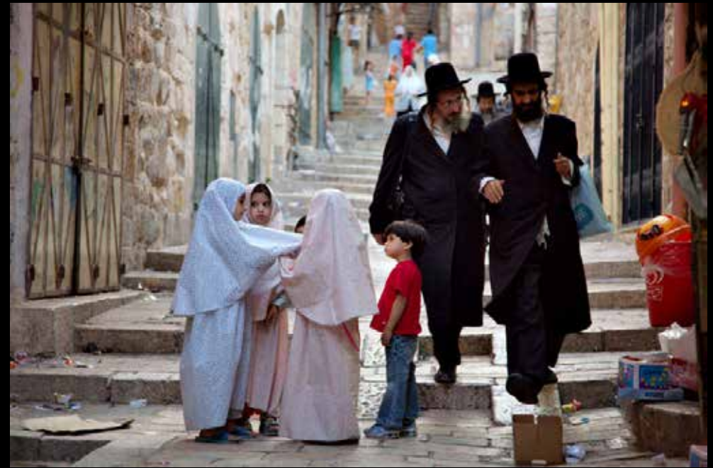
Legenda da foto. Nome do fotógrafo, ano