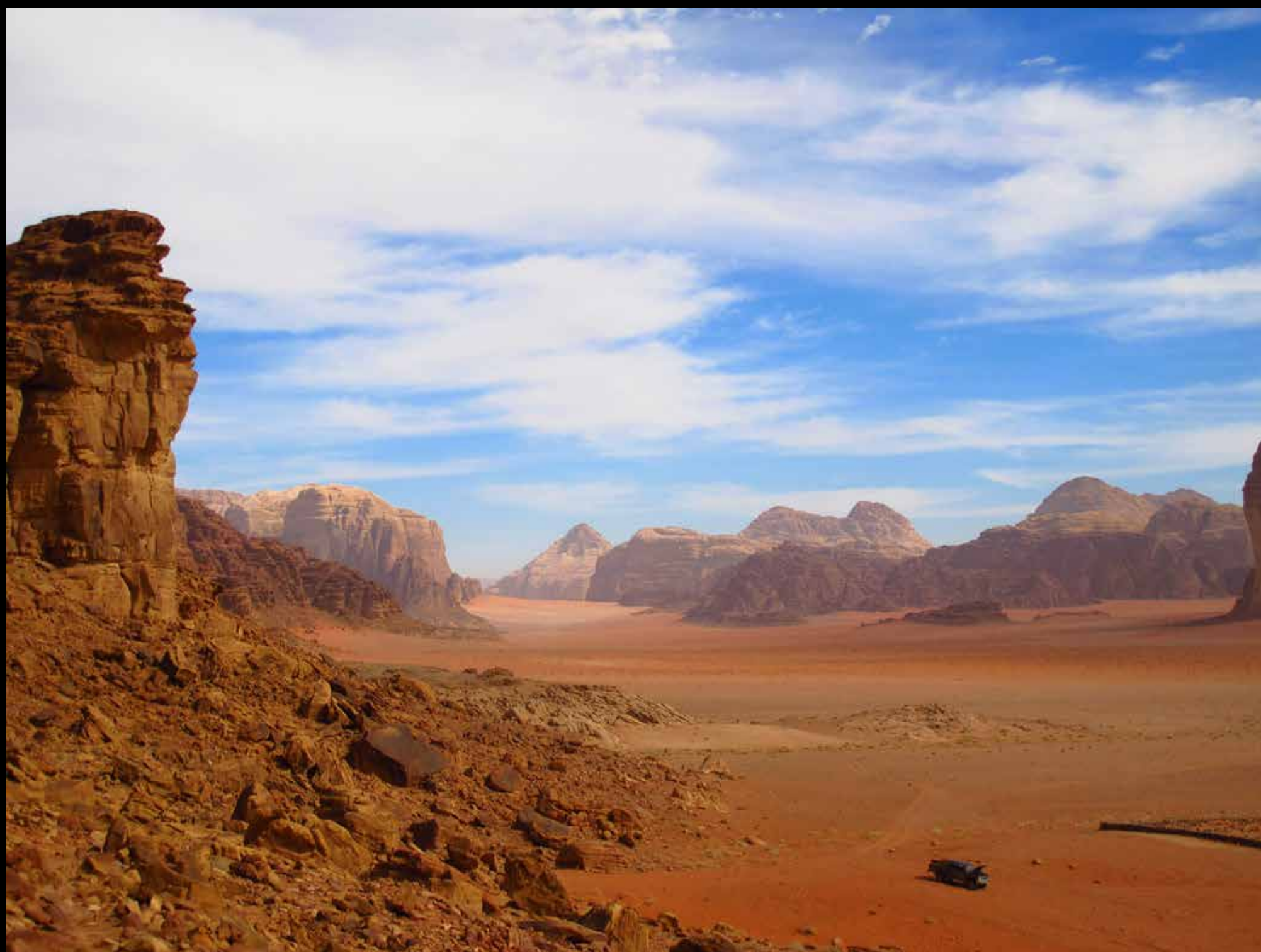
Legenda da foto. Nome do fotógrafo, ano